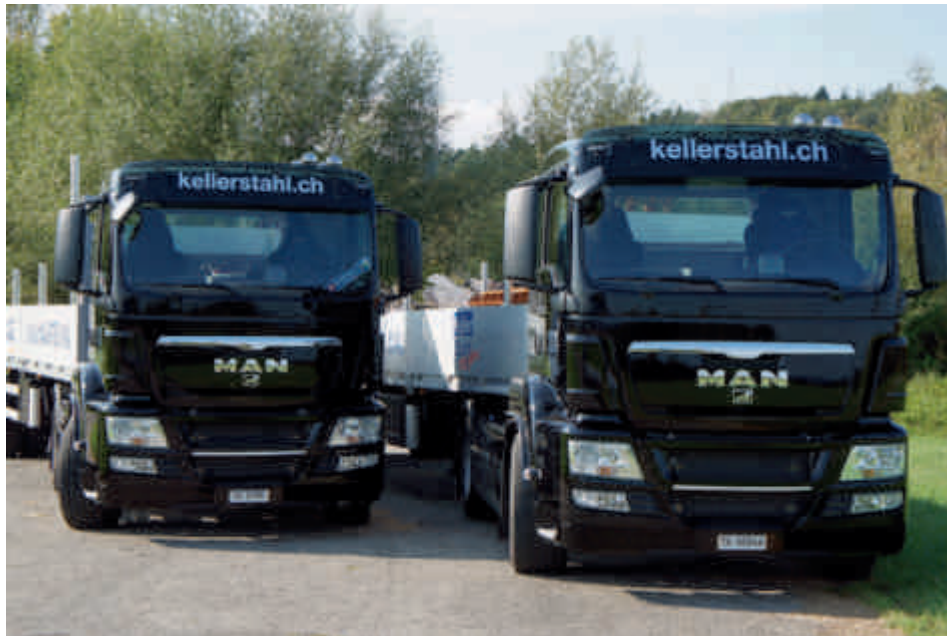
Schönheiten in schwarz: Die zwei neuen MAN TGS 18.400 der Keller-Stahl AG.

Auch etwas fürs Auge: Die zwei neuen, in edlem Schwarz gehaltenen und durch einige zusätzlichen Extras «optisch optimierten» Keller-Stahl MAN's sind mehr als nur gerade Transporter. Sie sind als «rollende Visitenkarten» auch wichtige Repräsentanten des traditionsreichen Familienunternehmens.