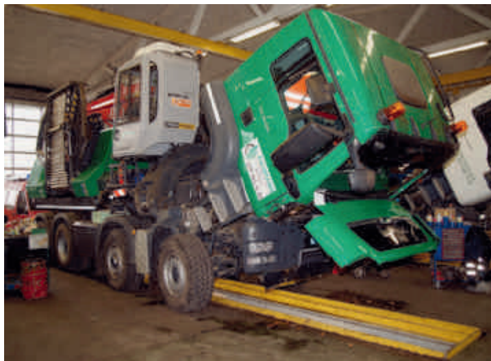
Von Jung bis Alt immer mit allen Technik-Generationen klar kommen: Blick in die LKW-Werkstatt der ALFAG im November 2011.

können, sobald dessen Markteinführung erfolgt. Das bedeutet Weiterbildung, und angesichts des heutigen Neuerungen-Tempos ist dies praktisch ein nie endender Prozess. Aber auch das darf erwähnt sein: Hohes Tempo im Nägel-mit-Köpfen machen liegt uns, lag uns schon immer.»